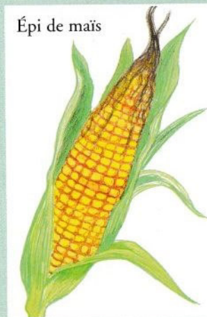
Épi de maïs