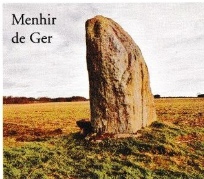
Menhir de Ger

De ce plateau austère planté de menhirs et de pierres remontant à la pré-histoire, vous pourrez admirer une vue panoramique exceptionnelle sur la chaîne des Pyrénées et la plaine de Tarbes.