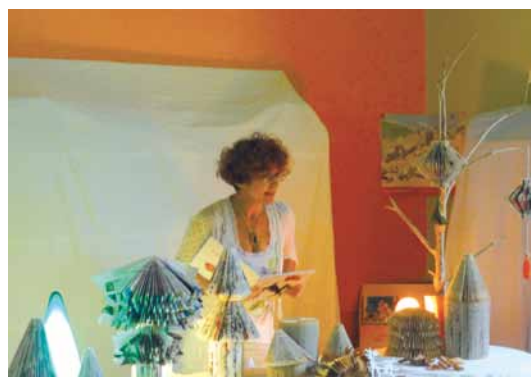
Je plie, tu plies, il plie - bibliothèque de Soumoulou