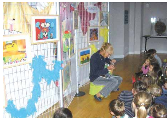
Exposition Musette souricette - bibliothèque de Pontacq

Vous pourrez retrouver le programme des actions culturelles des bibliothèques de l'Ousse et du Gabas dans les bibliothèques et points lecture du réseau, auprès des mairies du territoire et sur le site Internet de la CCOG dans le courant du mois de janvier 2013.