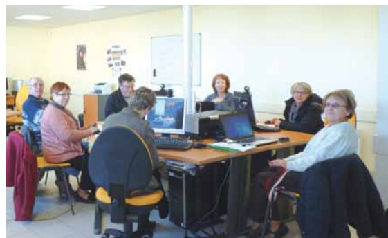
Atelier à la cyber-base de Ger

Abonnement de 12 mois, ateliers inclus :