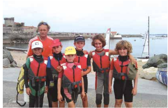
L'équipe jeune en régate à Socoa

Depuis 2009, le Club nautique pyrénéen s'est installé sur les berges du lac du Gabas. Il a de suite remporté un franc succès auprès de la population locale : plus de la moitié de ses membres sont issus des communautés de communes riveraines. Devenu le second club des Pyrénées-Atlantiques en terme d'effectif, il s'est de suite ouvert à tous les publics en développant un pôle handivoile et en accueillant les centres de loisirs et les écoles. Ses quelques 130 membres y pratiquent catamaran, dériveur, planche à voile ou canoë kayak autant en loisir