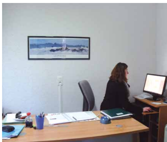
Bureaux de l'ADMR - Maison coupau à Soumoulou

Les bénévoles de l'ADMR sont à votre écoute. Vivant près de chez vous, ils connaissent bien votre environnement. Ils définissent, avec vous, une offre personnalisée et vous conseillent sur son financement. Ils en confient ensuite l'exécution à des professionnels qu'ils encadrent.