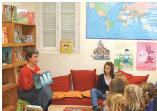
Chanter les livres - bibliothèque de Nousty