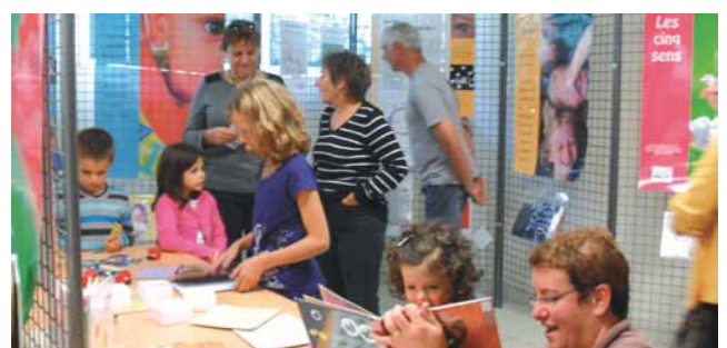
Exposition Les cinq sens - point lecture de Lourenties

Le point lecture accueille également les scolaires de l'école de Lourenties tous les vendredis et propose, pour tous, des expositions et des animations dans le cadre du réseau des bibliothèques de l'Ousse et du Gabas.