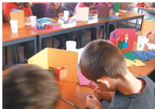
Atelier de Monica Ugarte - CCOG