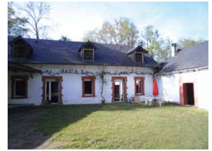
Le moulin de la Gélina à Ger

Depuis sa création, l'association a proposé des rencontres artistiques, des soirées spectacles et des lectures. Durant toute l'année, elle accueille des collectifs pour de courtes résidences. La période estivale est l'occasion de proposer des stages d'été ; 2011 et 2012 ont été l'occasion de s'initier au théâtre, à l'écriture, ou encore à la réalisation de scénario.