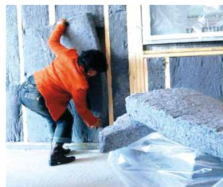
Pose de métisse pour l'isolation des murs