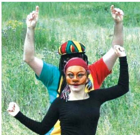
Découvrez le jeu théâtral masqué de la commedia dell'arte

Cet été, Le Moulin à paroles vous propose :