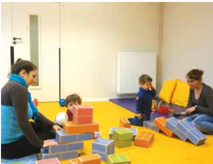
Les locaux de la crèche de Pontacq

Lundi 10 juin 2013, la nouvelle crèche intercommunale de Pontacq ouvrait ses portes dans les locaux rénovés de l'Arrayade, ancienne école maternelle.