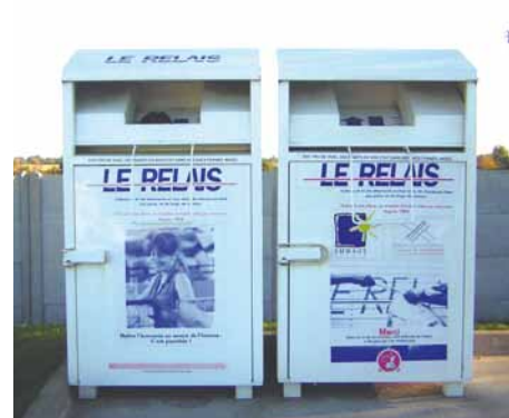
Pensez aux bornes du Relais 64 !

Avant de vous rendre en déchetterie, pensez aux bornes du Relais 64 mises à votre disposition dans les communes de Barzun, Ger, Nousty, Pontacq et Soumoulou. Tous types de textiles, même défraîchis, démodés, déchirés ou abîmés peuvent et doivent être déposés dans ces bornes. Ils pourront ainsi trouver une seconde jeunesse en étant transformés en isolant dénommé « métisse ».