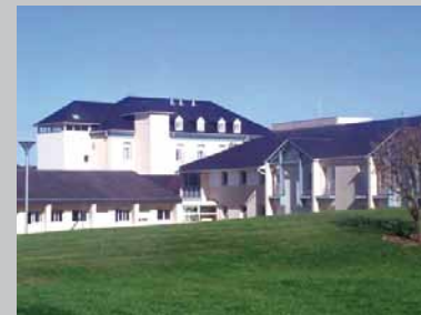
Centre gérontologique de Pontacq

Le centre gérontologique de Pontacq est un établissement d'accueil et de soins des personnes âgées quel que soit leur niveau d'autonomie.