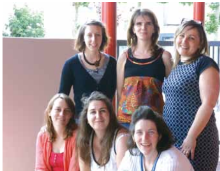
L'équipe de la crèche de Pontacq