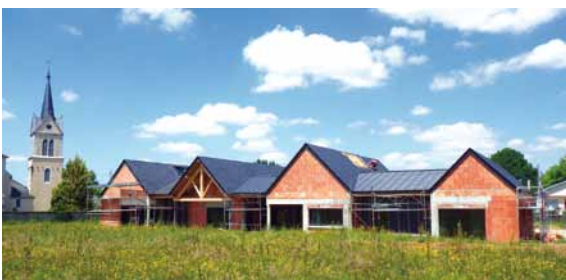
Les bâtiments de la future crèche de Ger

Cet établissement s'inscrit effectivement dans un projet de pôle petite enfance qui couvrira l'ensemble du territoire avec trois structures : la crèche de Nousty, ouverte en 2004, qui accueille aujourd'hui vingt enfants, la crèche de Pontacq qui ouvre cette année et la crèche de Ger, dont le chantier avance à un rythme soutenu en dépit des dernières intempéries ! Au cœur de ce service petite enfance intercommunal, le relais d'assistantes maternelles (RAM) assurera différentes missions auprès des assistantes maternelles, des parents, des enfants et des professionnels de la petite enfance. Le siège du RAM positionné à Pontacq sera très vite complété par deux antennes situées sur les deux autres pôles du territoire, à l'est sur Ger et à l'ouest sur Nousty.