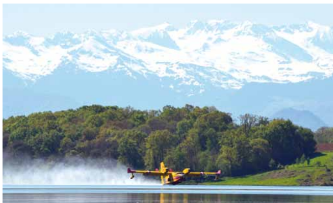
Les Canadairs du Service départemental d'incendie et de secours des Pyrénées-Atlantiques en reconnaissance sur le lac du Gabas au mois de mai 2013

L'année 2013 verra l'implantation d'un bâtiment destiné à accueillir une base nautique, animée par le Club nautique Pyrénéen auparavant implanté à Eslourenties. La pente bétonnée destinée à la mise à l'eau des bateaux, le chemin d'accès et la plateforme clôturée ont déjà été réalisés. Ces travaux ont permis d'accueillir en avril la quatrième édition du Critérium Inter-régional des Pyrénées, organisée par le Club nautique Pyrénéen. Quarante-neuf coureurs âgés de 6 à 65 ans ont pris le départ de cette régates qui a vu, pour la première fois depuis la création de cette compétition, des navigateurs locaux prendre place sur les podiums.