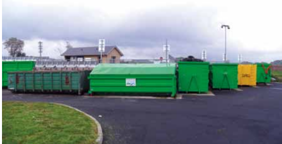
La déchetterie de Pontacq

Pour répondre à ces objectifs, le site a été élargi et un second portail a été installé pour mettre en place un sens unique de circulation en haut de quai. Cinq quais supplémentaires ont été ajoutés pour permettre d'affiner le