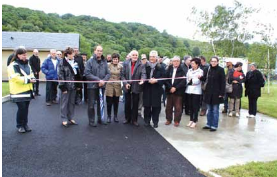
Inauguration par les élus le jeudi 23 mai 2013

tri, prévoir des bennes de secours en période de forte affluence et anticiper de futures réglementations.