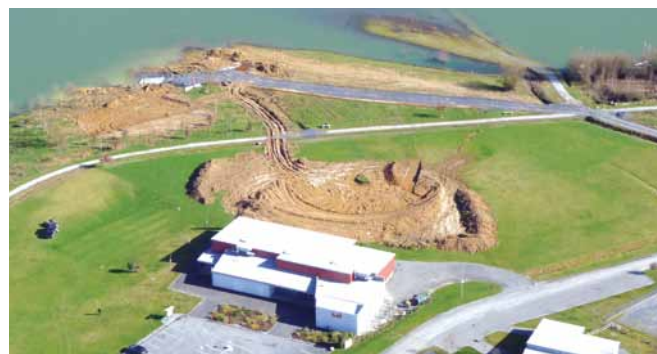
Les travaux d'aménagement en cours

mise en forme du site a été réalisée cet hiver en réutilisant la terre issue de la plateforme de la base nautique. Le lycée horticole Adriana de Tarbes, qui propose des formations en aménagement paysager, a déjà manifesté son souhait de participer au projet.