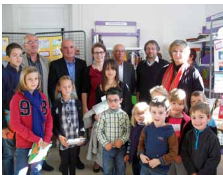
Remise des prix par le jury