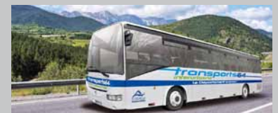
Les bus interurbains du CG 64

Plus d'informations sur le site : www.transport64.fr