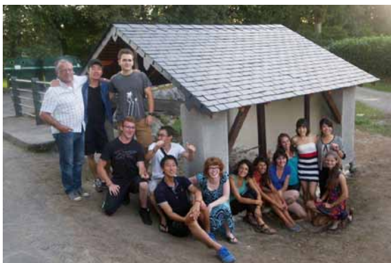
Les jeunes volontaires devant le lavoir de Barzun en cours de rénovation