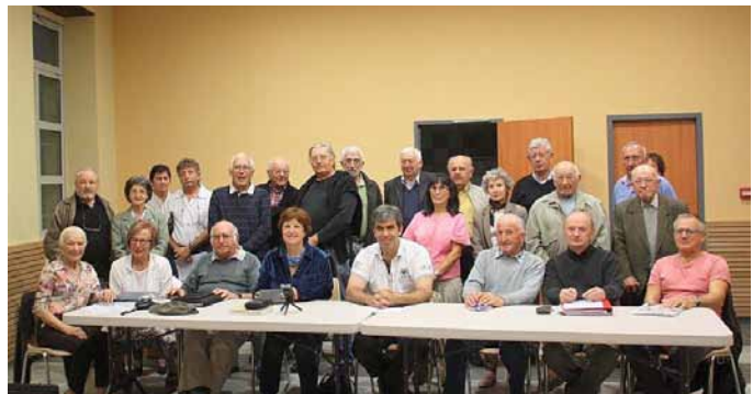
Assemblée générale du 26 octobre 2013

L'association « Patrimoine en Ribère-Ousse », créée en juillet 2007, a son siège social à la Mairie de Pontacq. A ce jour, l'association compte une cinquantaine de membres venant pour la plupart de notre vallée mais également d'autres villes et villages de France. Le but de notre association est de contribuer à la conservation du patrimoine de notre vallée, d'effectuer des recherches historiques, de diffuser des publications, d'organiser des soirées conférences (l'immigration en Amérique, la résistance...) et des expositions (le textile, le cuir, le patrimoine agricole...).