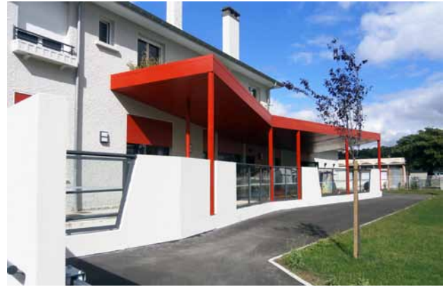
Les locaux du RAM

Ces deux chiffres confirment un réel besoin sur notre territoire qui compte aujourd'hui 112 assistantes maternelles et fait l'objet d'une forte demande de solutions d'accueil pour les jeunes enfants.