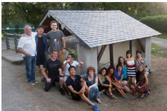
Les jeunes volontaires devant le lavoir de Barzun en cours de rénovation