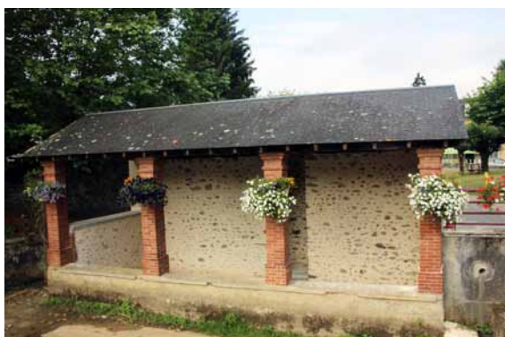
Le lavoir de Pontacq rénové par les employés municipaux en 2013