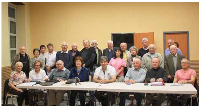
Assemblée générale du 26 octobre 2013

L'association « Patrimoine en Ribère-Ousse », créée en juillet 2007, a son siège social à la Mairie de Pontacq. A ce jour, l'association compte une cinquantaine de membres venant pour la plupart de notre vallée mais également d'autres villes et villages de France. Le but de notre association est de contribuer à la conservation du patrimoine de notre vallée, d'effectuer des recherches historiques, de diffuser des publications, d'organiser des soirées conférences (l'immigration en Amérique, la résistance...) et des expositions (le textile, le cuir, le patrimoine agricole...).