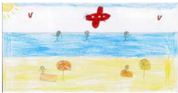
1 er prix des 8 ans et moins : Léa Autuoro

Le jury du concours a eu la difficile tâche de départager les participants et de nommer 4 gagnants :