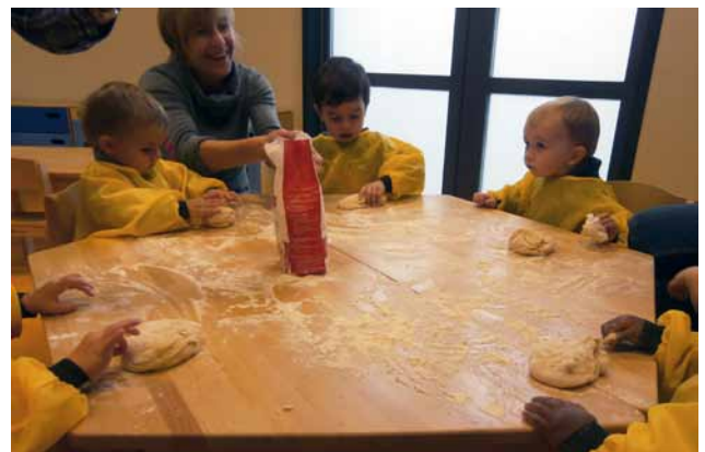
Atelier de fabrication du pain