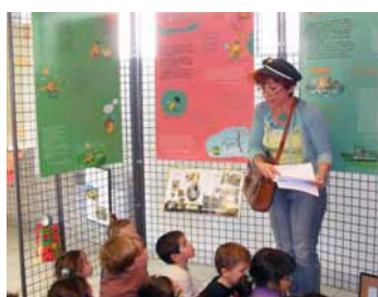
animation par S. Dugachard au Point lecture de Lourenties

Point lecture de Lourenties mairie de Lourenties - place de l'église - 64420 Lourenties / 05 59 04 12 29 mardi : 9h-12h vendredi : 14h30-18h15 samedi : 10h30-12h