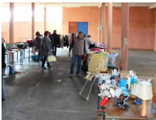
Le hall d'Ossau le 16 novembre 2013

Aucune valeur monétaire n'étant donnée aux objets troqués, aucune transaction d'argent n'a eu lieu et chacun a pu y participer. Le principe était simple : un objet apporté = un objet récupéré. Cette action économique et solidaire a permis de remettre en circuit des objets en bon état mais inutilisés qui finissent généralement par être jetés.