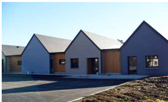
structure multi-accueil de Ger