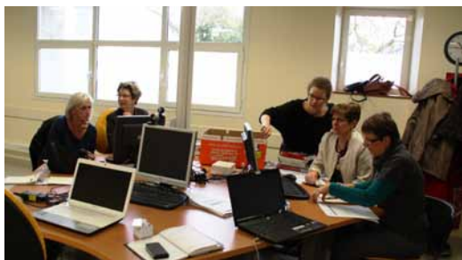
Les bénévoles de la bibliothèque de Barzun en formation sur le logiciel

Depuis plusieurs mois, des ordinateurs ont été installés dans les bibliothèques du réseau. Encore inutilisés, pour la plupart d'entre eux, pour les permanences d'accueil du public, ils fonctionnent pourtant à plein régime dès que les bibliothèques ferment leurs portes. Pour pouvoir prêter les livres informatiquement, les bénévoles du réseau doivent tout