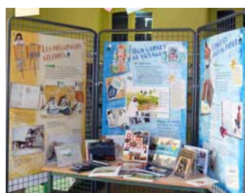
exposition Carnet de voyage, mode d'emploi à la Bibliothèque de Soumoulou