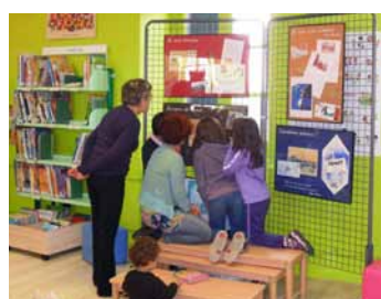
exposition Le voyage en toutes lettres à la Bibliothèque de Soumoulou