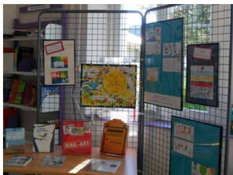
Exposition des oeuvres à la bibliothèque de Nousty

Les animations du réseau pour 2014 porteront sur le thème des jardins. L'été sera à nouveau l'occasion de tester votre créativité... Tenez-vous informé auprès de votre bibliothèque du lancement du concours 2014 !