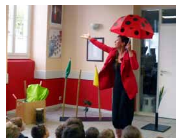
Histoires des 4 vents à la bibliothèque de Barzun