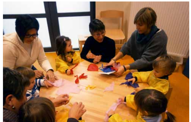
Atelier de réalisation de vitraux